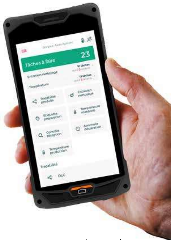
➤ Un tableau de bord limpide avec la solution Hygiène Expert HACCP de JDC SA.

L es obligations légales en matière d'hygiène figurent parmi les devoirs du métier de charcutier-traiteur. Les actions s'appliquent à toute la ligne de production comme la traçabilité des produits, l'enregistrement et l'archivage des étiquettes, le contrôle des livraisons à réception, le suivi du plan de nettoyage et de désinfection, les températures des enceintes frigorifiques et la digitalisation des relevés et des alertes en cas de panne. Si de plus en plus d'enseignes franchissent le pas pour s'équiper, encore beaucoup appréhendent le recours à ces services digitaux. Le bilan des inspections sanitaires réalisées par la Direction générale de l'alimentation (DGAL) en 2022 est éloquent : 48 % des contrôles dans le secteur boucherie charcuterie-traiteur ont abouti à des avertissements. Pleinement effective depuis le 1 er janvier 2024, la réforme de la sécurité sanitaire renforce les contrôles sanitaires tous secteurs confondus. La DGAL cible parmi les points préoccupants le nettoyage et la désinfection des locaux et des équipements, la maîtrise des conditions et températures de conservation des produits, la conformité des produits finis, la traçabilité et, pour la procédure à l'hygiène du personnel, la tenue vestimentaire et le lavage des mains.