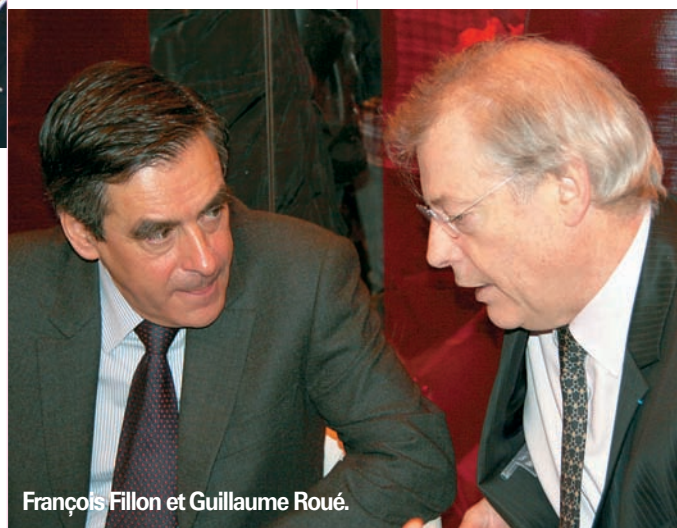
François Fillon et Guillaume Roué.

● Le trophée national du Poitou-Charentes aura lieu en novembre 2012 (non pas en novembre 2011) dans le cadre du salon Carrefour des métiers de Niort.